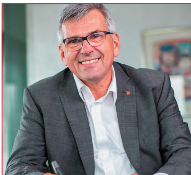
Jörg Hofmann, 1. Vorsitzender der IG Metall:

„Die IG Metall ist stark und durchsetzungsfähig – dank ihrer Mitglieder. Das gilt gerade auch für die Textil- und Bekleidungsindustrie. Jetzt kommt die zweite Stufe des laufenden Tarifvertrags. Und 2,4 Prozent mehr Geld ab dem 1. Juni – das ist vor dem Hintergrund der aktuellen Inflationsrate mehr als eine Reallohnsicherung. Damit steigen die Verdienste real – es ist mehr Geld im Portemonnaie.“