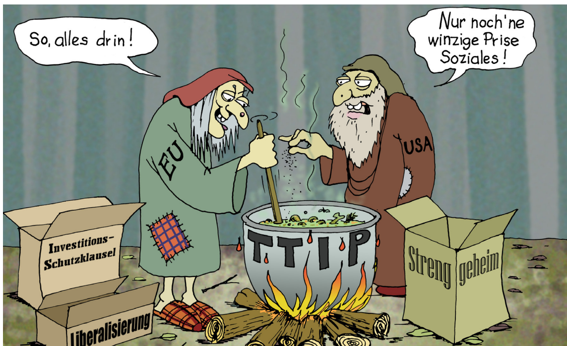
Karikatur: André PLOczech

Seit Sommer letzten Jahres verhandelt die Europäische Kommission mit dem US-Handelsministerium über ein Freihandelsabkommen (TTIP). Erreicht werden soll die Öffnung der Märkte durch den Abbau sogenannter „tarifärer Handelshemmnisse“ und eine Vereinheitlichung der Qualitätsstandards. Ein wichtiger Bestandteil des TTIP ist das sogenannte Investitionsschutzabkommen, welches den Unternehmen weitreichende Klagebefugnisse gegenüber den Nationalstaaten einräumt. Die Risiken für Arbeits- und Sozialstandards sind nicht zu übersehen.